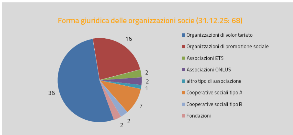
Figura 1 - Forma giuridica delle Organizzazioni socie (al 31.12.2025)

Nel 2025 si sono iscritte 6 Associazioni.