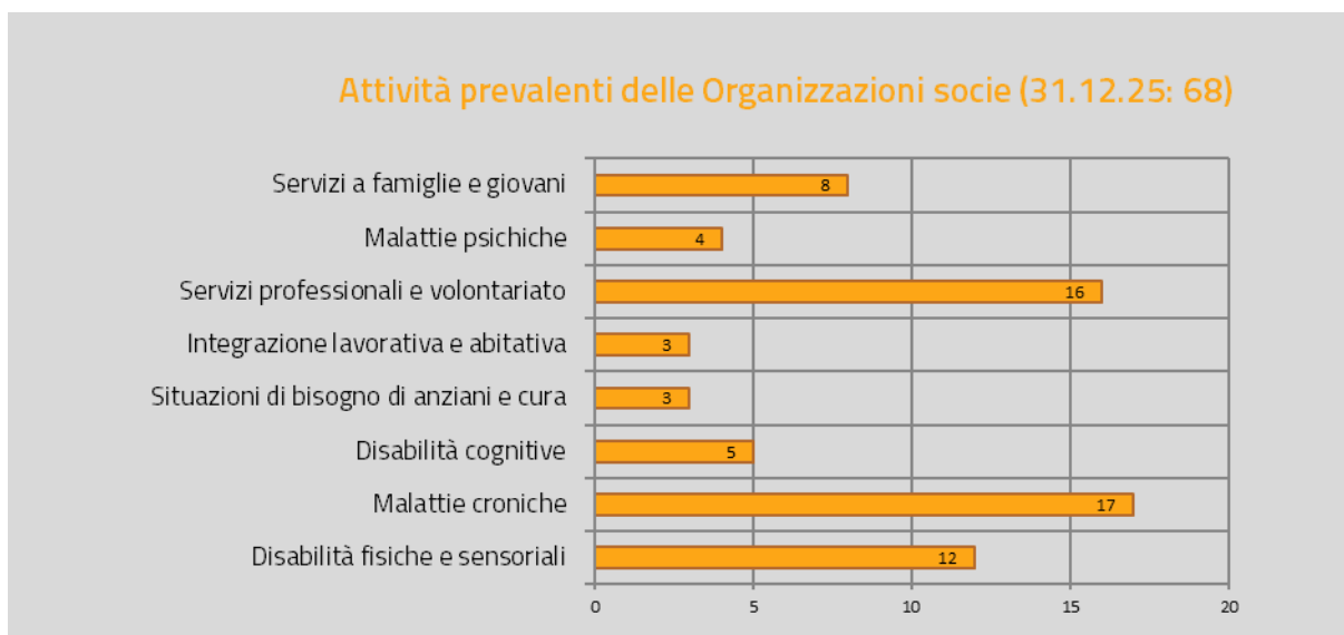
Figura 2 - Attività prevalenti delle Organizzazioni socie (al 31.12.2025)

(16) e delle disabilità fisiche e sensoriali (12). Gruppi più piccoli rappresentano, tra l'altro, l'assistenza sociale alle famiglie e ai giovani (8), i disturbi cognitivi (5), le malattie psichiche (4), l'integrazione lavorativa e il tema abitare (3) e le situazioni di emergenza nella terza età e nella cura (3).