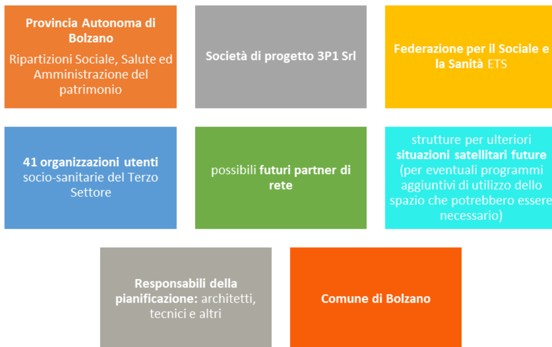
Figura 8 - Presentazione dei diversi attori coinvolti nella Casa per il Sociale e la Salute