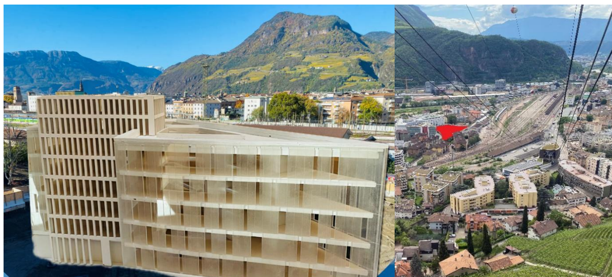
Figura 6 - a sinistra: visualizzazione della futura CSS; Figura 7 - a destra: ubicazione della futura CSS (evidenziata in rosso)