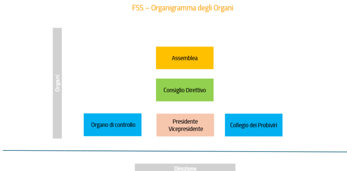
Figura 3 – Organigramma degli organi